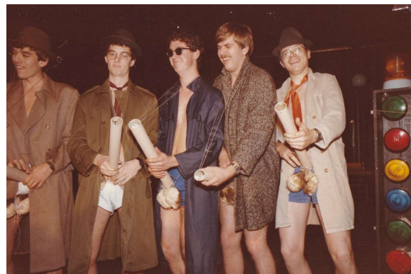
De KLC in 1984