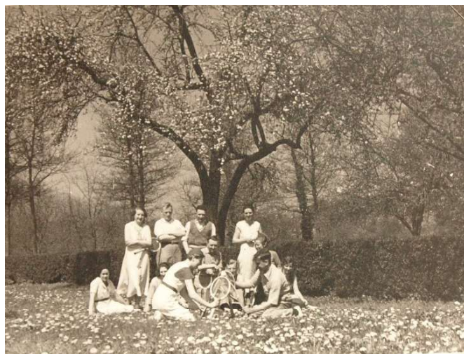
Tennisteam van Unitas SR van de Interacademialespelen 1930

“De mensen waarmee je normaal gesproken aan de bar staat een biertje te drinken proberen elkaar nu knock-out te slaan zeg maar, dat geeft wel een kick denk ik.”