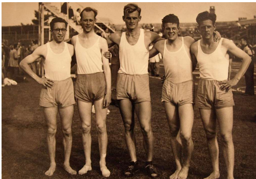
Unitasteam bij de interacademiale spelen 1930

“Dichtbij klinkt het gebrul van de anderen die u omringen, maar zij hadden er niet hoeven zijn; de focus ligt volledig op de persoon voor u.”