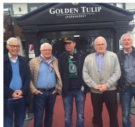
SB '68-'69 in 2016