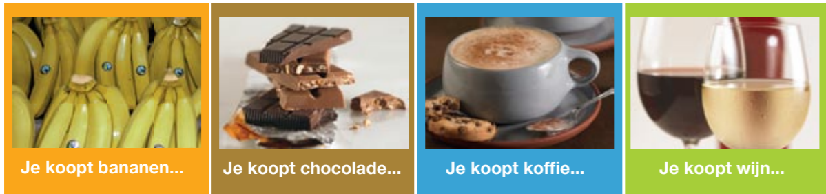
Je koopt bananen...